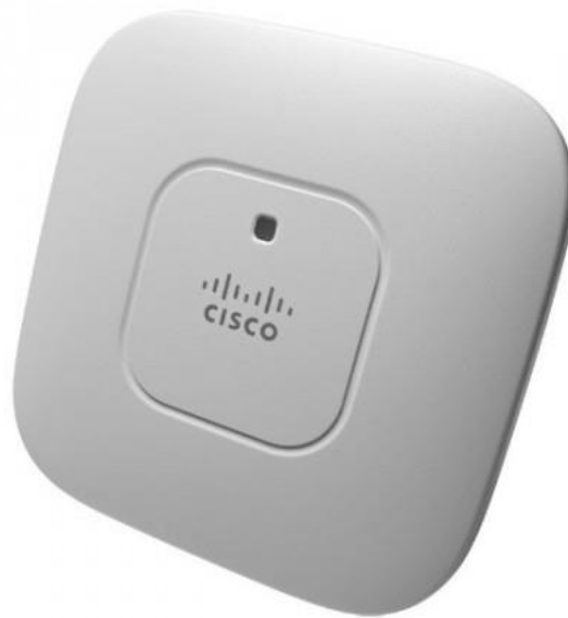
Figure 2-Borne WIFI Cisco